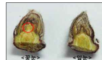
<꽃눈, 잎눈 사진>

꽃눈 분화율을 조사하려면 먼저 나무의 자람세가 중간 정도인 나무 3그루를 고른다. 눈높이 정도의 높이인 4년생~5년생 어미 열매가지(결과모지)로부터 끝눈 50개~100개를 캐낸다. 면도칼 같은 날카로운 칼로 캐낸 눈을 세로로 이등분한 다음 돋보기나 예찰용 확대경(루페)으로 관찰해 꽃눈인지를 판단한다.