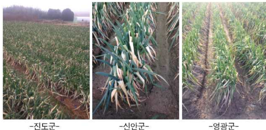
〈호남지역 겨울대파 생육상황〉

* 출처 : 한국농촌경제연구원 농업관측센터 관측속보('15. 1. 29.)