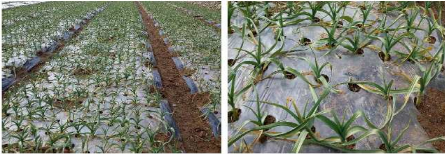
〈전남지역 마늘 작황 사진〉